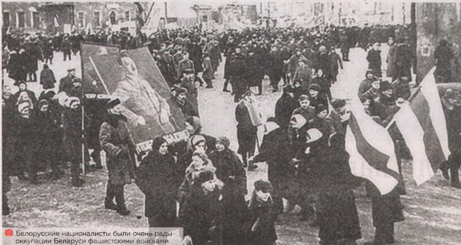
Белорусские националисты были очень рады оккупации Беларуси фашистскими войсками.

Для того чтобы понять, каким образом бело-красно-белая символика была взята на вооружение коллаборационистами, нужно внимательно посмотреть на персон, которые стояли у истоков белорусского национализма перед оккупацией нашей страны. 20 апреля 1939 года Василь Захарко, который был искренне уверен, что