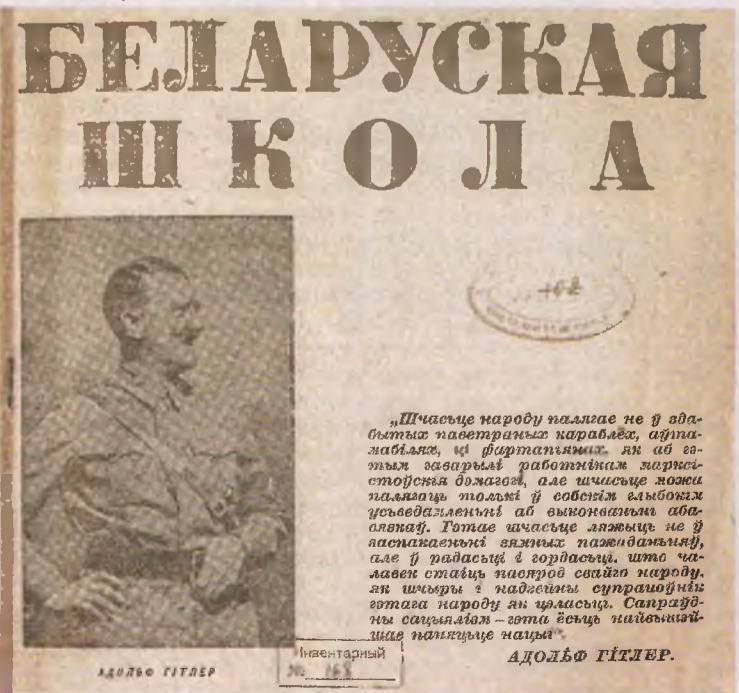
Первая страница журнала «Беларуская школа», который вышел в январе 1942 года, сразу после конференции школьных инспекторов Беларуси.

Во время бело-красно-белая символика, поднятая белорусскими националистами в знак приветствия немецких нацистов, спокойно появлялась в печати. Так, «Менская газета», к примеру, постоянно выходила с логотипом бело-красно-белого флага и изображением «погони». «Нужно понимать, что Вильгельм Кубе, генеральный комиссар Генерального округа Беларуси, в отличие от оккупационных властей Украины и России сделал ставку на белорусский национализм. Он провозглашал лозунг «Беларусь для белорусов» и поощрял это движение», — доктор исторических наук уверен: белорусские националисты искренне верили, что у них есть шанс создать марионеточное государство под протекторатом и контролем Германии, где они станут главными начальниками. Именно поэтому в том числе вся оккупационная профашистская белорусская печать того времени проникнута ненавистью к евреям и восхвалением Гитлера.