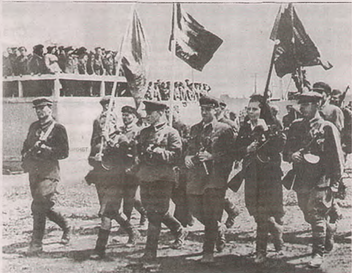
Партизанский парад в Могилеве.

Именно белорусские народные мстители начали освобождение своей республики, создавая с 1942 года на ее территории партизанские зоны. В них восстанавливались органы советской власти, велись сельскохозяйственные работы, действовали небольшие предприятия, школы, больницы, во многих зонах функционировали аэродромы. Всего возникло 20 партизанских зон, на которые в конце 1943 года приходилось около 60% территории Беларуси, еще находившейся под оккупацией. С каждым годом войны усиливалась помощь