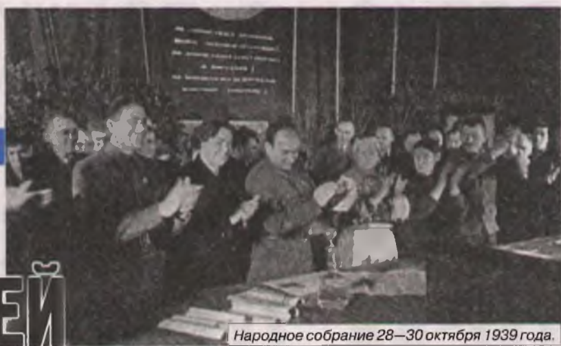
Народное собрание 28–30 октября 1939 года.

Почему сегодняшний день в 1990 году парламент БССР провозгласил праздником