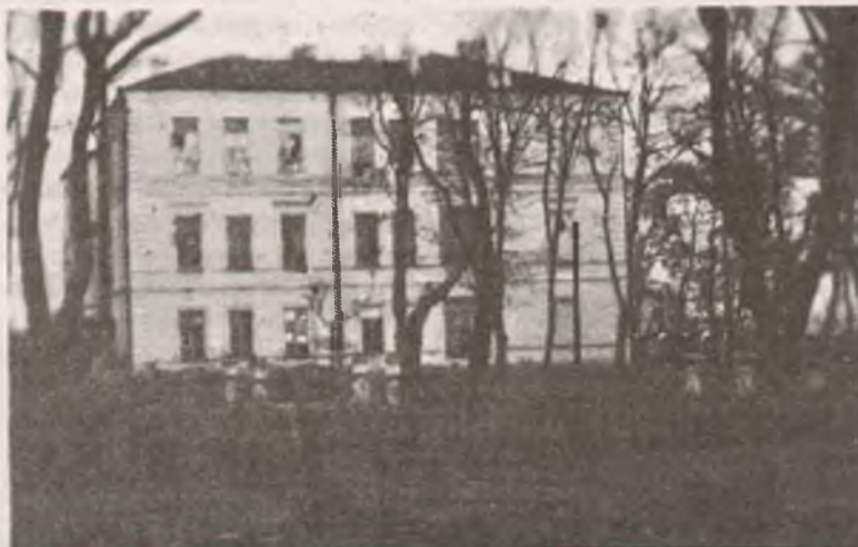
Здание больницы, где размещался госпиталь 172-й стрелковой дивизии, немецкое фото, 1942 год.