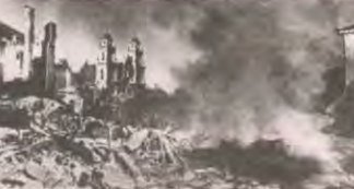
Реалии гитлеровского «нового порядка» в оккупированном Минске: разрушенный жилой и промышленный фонд — и один из крупнейших в Европе еврейских гетто.