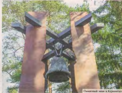
Памятный знак в Куропатах.