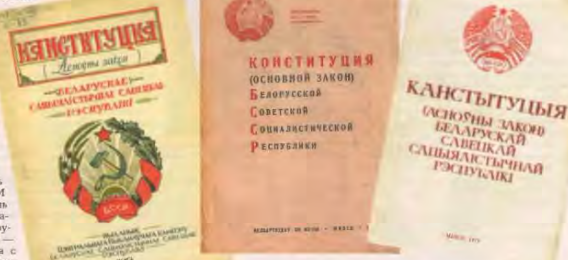
Конституции БССР 1927, 1937 и 1979 годов: преемственность развития с корнями из оной старины.

Видны впервые были зафиксированы принципы индивидуальной ответственности, частной собственности, свободы выхода женщины замуж и свободного выезда за границу (кроме стран, с которыми княжество в этот момент вело войну). И подчеркивалось, что анонимный договор не может быть основанием для возбуждения уголовного дела.