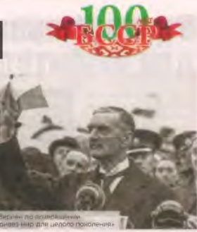
Чемберлен по возвращении из Мюнхена в 1938 году

Что же касается Подкарпатской Руси (Карпатской Украины), то ПАТ требовало присоединения этой территории к Венгрии, мотивируя подобно анекдоту характерным аргументом: «Польша и Венгрия будут иметь общие границы и таким образом ликвидировается тот коридор (Закарпатье), который дает немцам возможность связи с большевиками. Если Карпатская Украина будет присоединена