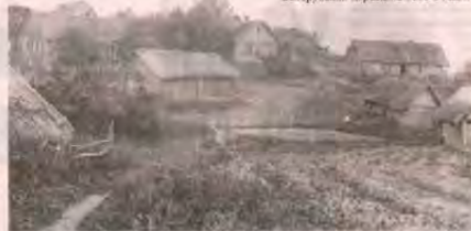
Белорусская деревня в 1920-е годы.