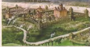
Польским княжеством управляло княжеское вече.

Особенно сильно на право Беларуси раннего периода государственности (конец X — середины XIII века) оказывало влияние византийская, сербская и болгарская традиции. В то время существовали три основных источника власти: князь, княжеский совет и вече. Если князь являлся главой государства и носителем, выражался по своему усмотрению исполнительную власть, то вече — законодательной. Известно, например, что Польша и Венгрия достаточно жестко ограничивало власть князя и утверждало его легитимность. Без собрания вече нельзя было ввести новые виды податей, решить вопрос об объявлении войны или мира.