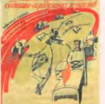
Линьдвирнем излучаество наан КПСС

тальной — 60 и 180 пудов соответственно. По тем временам это был невероятный результат. Пришепов не позволился приехать в Костюковичи и лично поблагодарить Николаевича за точное соблюдение рекомендаций Наркома.