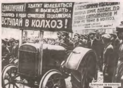
Агитация за колхозы.

— Показ был иной: все было поставлено на научную основу. В 1928 году вышла работа белорусского учено-агронома Дядо Кислякова «Половая агитация фертилиты и эффект землеустройства», получившая широкий резонанс в РСФСР. В этой работе был рассчитан оптимальный размер земельных наделов для различных культурных приращивания крестьян-