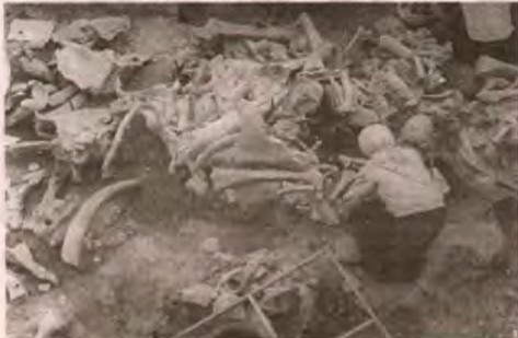
Скопление костей мамонта, найденное во время раскопок стоянки Бердыж, 1920-е годы.