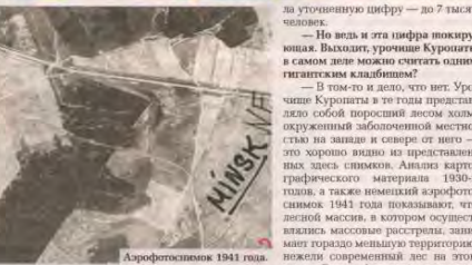
Аэрофотоснимок 1941 года.