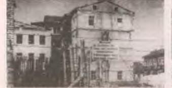
Реалии гитлеровского «нового порядка» в оккупированном Минске: разрушенный жилой и промышленный фонд — и один из крупнейших в Европе еврейских гетто.