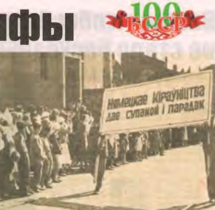
■ Приветствие «новой порадки», построенной на насилии и крови, коллаборанты скорее дискредитировали идею национального возрождения, нежели способствовали ей.