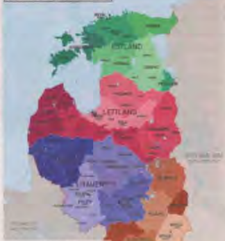
В созданном 17 июля 1941 года рейхсгоскомисариате Остланд генеральному округу Белоруссия отводилась совсем скромная роль в территориальном плане. И практически нулевая — национальном.

«Наши учителя не должны приходить к том и думать в школу их детей. Если русские, украинцы, киргизы и пр. изучают читать и писать, нам это только повредит. Пожар, 4 октября 1943 года, выступая в Познани перед руководством СС, Гиммлер призывал «оживить другим народам в бытовом отношении или они издохнут от голода, интригуют меня лишь постылая, поскольку они нужны как рабы для нашей культуры, и в этом смысле это мене не интересует. Показуй им нет от изуродован при создании протекторатного рва 10.000 русских боб, интересуют меня лишь в том отно-