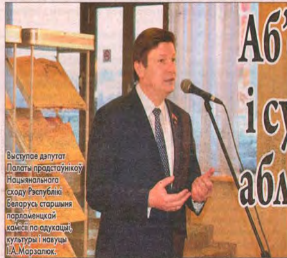
Выступе дэпутат Палаты прадстаўнікоў Нацыянальнага сходу Рэспублікі Беларусь старшыня парламенцкай камісіі па адукацыі, культуры і навуцы І.А.Марзалюк.