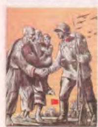
Подать руку поляки вратские народни Западн. Украины «Знамя Беларусі»