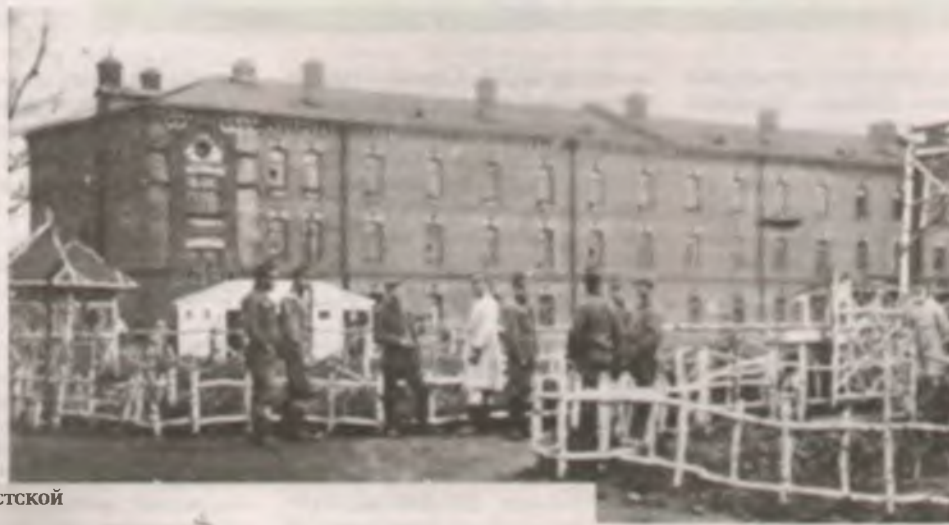
Лагерь в Березе-Картузской.

ный декрет президента Польши Игнатия Мосцицкого и правительства о местах изоляции социально опасных элементов. Этот декрет нарушал международные обязательства Польши, гражданские права и нормы правосудия. В результате со второй половины июня 1934 года до сентября 1939-го в местечке Береза-Картузская действовал лагерь, режим в котором был крайне жестоким. Через этот лагерь, по неполным данным, прошли около 10.000 белорусов, русских, евреев, украинцев, а также польских политических оппонентов Юзефа Пилсудского. До сих пор можно встретить утверждения, что там содержались лишь террористы-бандеровцы и радикальные коммунисты. Но это ложь. Там содержались и протестанты, и те, кто просто не хотел становиться поляком. И потому даже политические оппоненты могли столкнуться в бараках этого лагеря нос к носу.