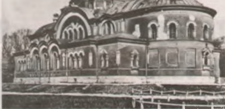
Храм в Брестской крепости, переделанный в костел. Конец 1920-х.