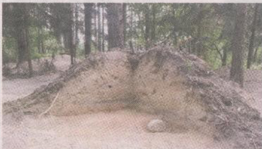
В кургане археологи вместе с человеческими останками обнаружили поясной набор дружинника времен Киевской Руси и арабский дирхем.

— Предположительно, найденный нами воин был одним из участников похода на радимичей. Произошло это за четыре года до официального приня-