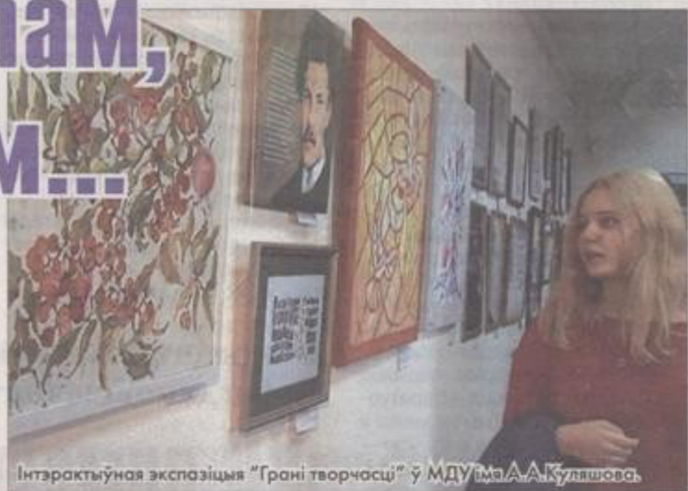
Інтэрактыўная экспазіцыя "Грані творчасці" ў МДУ імя А.А.Куляшова.