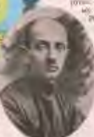
Александр Духин был заместителем первого заместителя председателя ЦК ВКП(б) в Белоруссии.

— Да, именно так, но в 1922 году было создано Украинское и Белорусское государственные образования. Молдавия на территории бывшей БССР не существовала этой реальной территории.