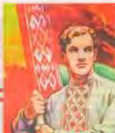
НАХАН ЖЫДЕ СІДЭЦКАЯ БЕЛАРУСЬ!