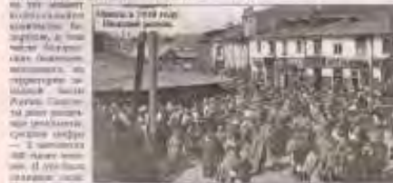
Мінск у 1949 годзе