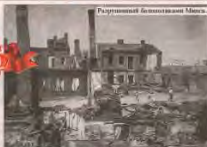
Разрушенный Белоставомин Мінск.

общей борьбы с главным врагом белорусского народа — польскими оккупантами. Ты ведь эсеры ориентировались в основном на внутренние страны, воевали в своем истинном смысле. Был создан польско-эсеровский комитет, в который вошли и белорусские коммунисты. И даже польской оккупации создавались партизанские отряды. В Эстонии руководство эсеров пришло из Германии с финскими представителями Туллиаски — два типа, чтобы установить дружбу с Москвой.