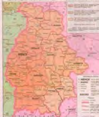
Административно-территориальный разрез Беларуси января 1918 года

— Именно на этом совещании была очерчена территория Белорусской Республики, и сегодня южной границей была линия 5 губерний: Гродзенская, Минская, Могилевская, Витебская и Смоленская.